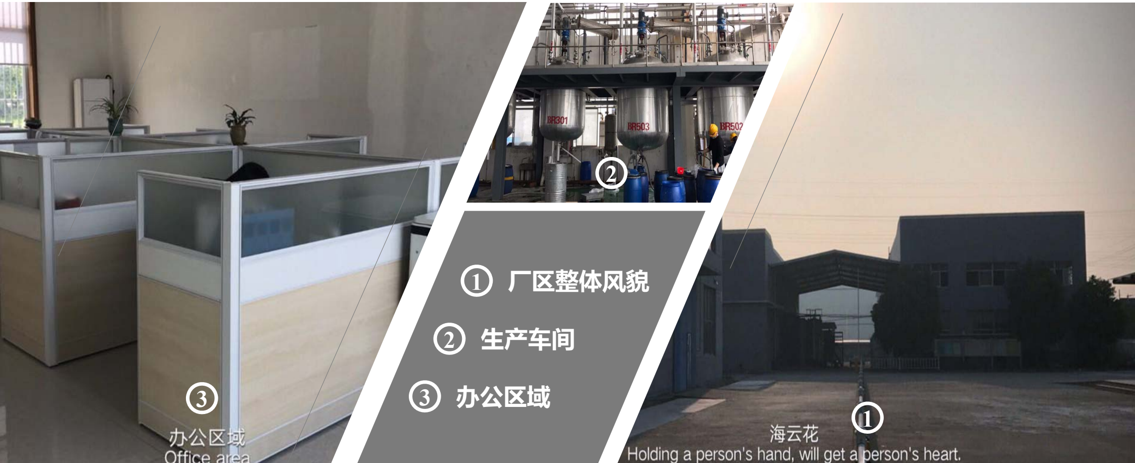
③ 办公区域 Office area